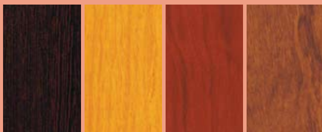
4572 - Wenge